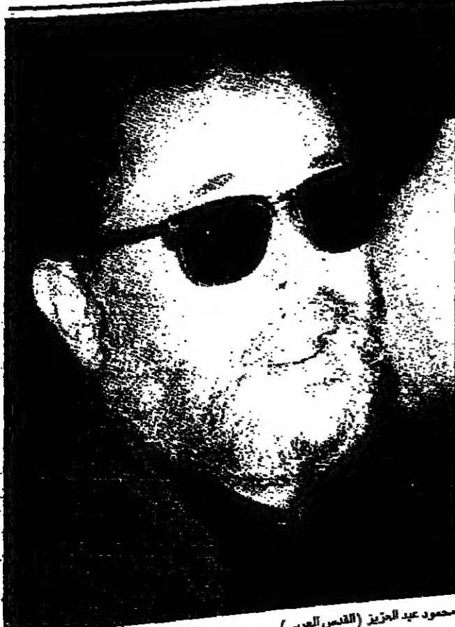
محمود عبد العزيز (القديس العربي)

9:00 القرآن الكريم، 9:30 مساء الخير أوبت، 10:00 برنامج مقابلة شخصية- الأمير خالد بن سلطان، 11:30 برنامج وثائقي-سحار الحزين، 12:00 حائل غنائي، 12:30 المسلسل المصري- عطاء بلا حدود، 13:30 برنامج فيديو كليب، 14:00 المسلسل للديج-العطش، 15:00 برنامج لقاء بالخير-سراج الحدي، 15:30 برنامج أغاني وجهود، 16:30 للمسلسل المصري-إسلام مسروقة، 17:30 كلمة وعود-تاجي ساي، 18:30 برنامج على الهواء، 20:00 مسلسل إبناني-العاصفة تهب مرتين، 21:00 كان زمان، 22:30 في سكون الليل، 22:45 فاصل غنائي، 23:00 برنامج لقاء بالخير-سراج الحدي، 23:30 للمسلسل المصري-أحلام مسروقة، 00:30 برنامج فيديو كليب، 1:00 كلمة وعود-تاجي ساي، 02:00 مسلسل